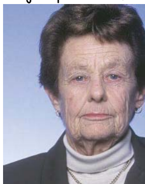
Lice nije u središtu

Primjeri pravilnih fotografija glede centriranja