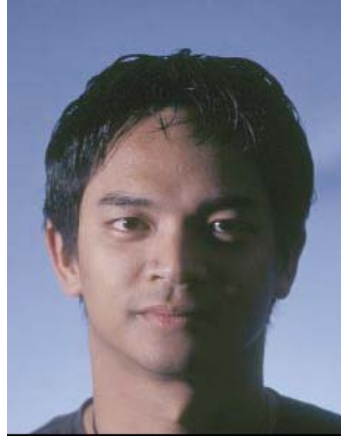
Sjene na licu